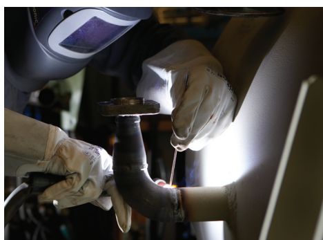
Zum Schweißen von Stahl und Edelstahl und anderen DC-verschweißbaren Materialien