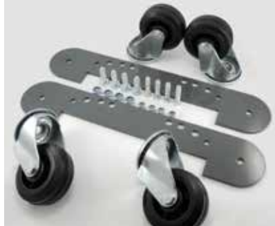
Radsatz zur Montage unter dem Schutzbügel (Artikel-Nr. 78861413)