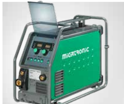
Schutzbügel (Artikel-Nr. 78861506) Hier am Omega Yard Pulse montiert.