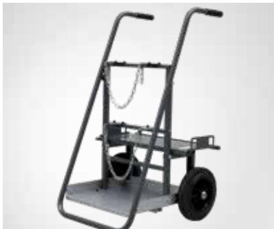
Fahrwagen für die Gasflaschenhalterung und den -transport (Artikel-Nr. 78857031)