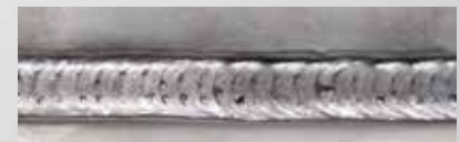
DUO Plus - Edelstahl

DUO Plus erhält optimal die Stärke des Stahls und gewährleistet eine WIG-ähnliche Schweißnaht.