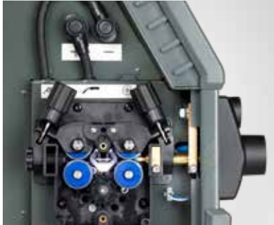
LED-Licht in der Drahtkonsole (Artikel-Nr. 78861545)