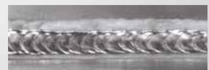
DUO Plus - Aluminium

Die Funktion verbessert die Überwachung des Schweißbades und verringert die Wärmezufuhr.